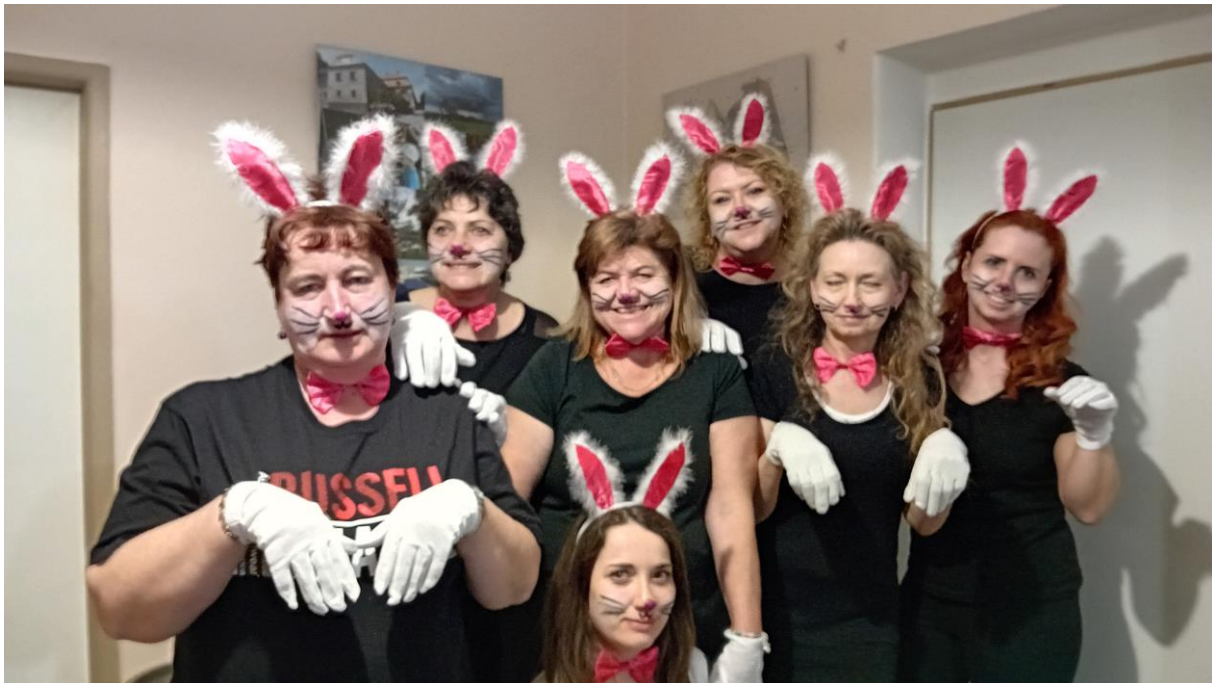
Vystoupení na Babském bále