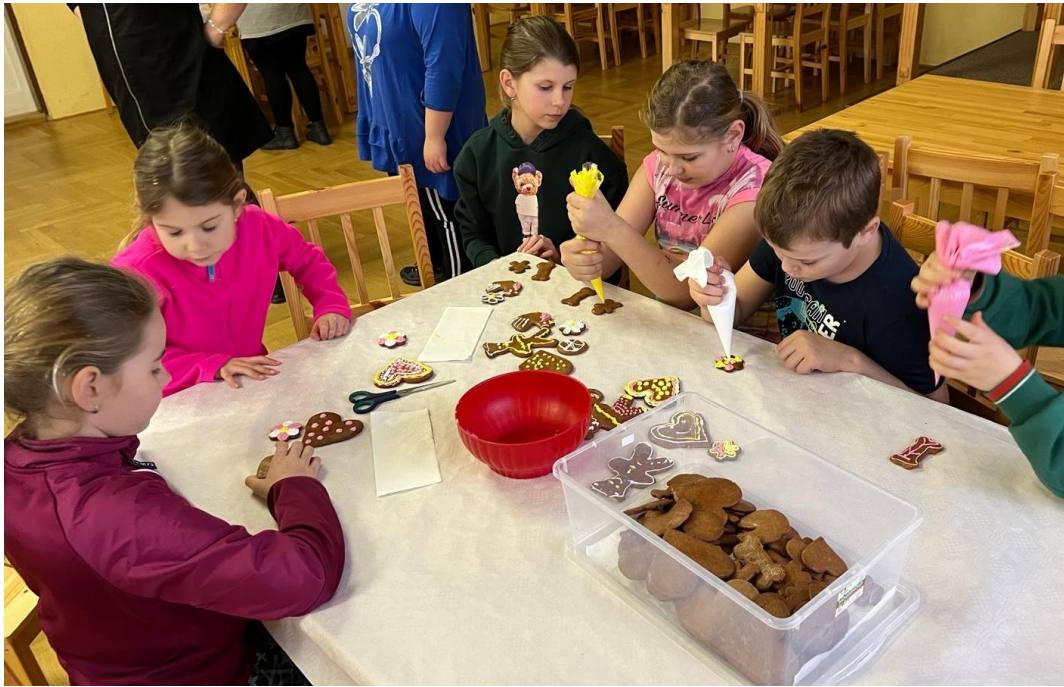
Velikonoční tvořivá dílna