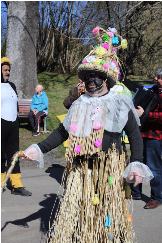
Nejaktivnější maska roku