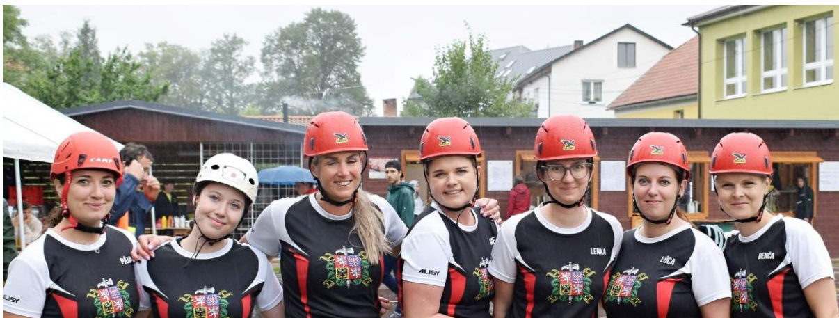
Na 6. kole BL v Jesenici u Sedlčan

29.6. – Výlet Klubu žen- Vrchtovy Janovice a Vlašim. Ačkoli byl parný den, obě místa nás mile překvapila, nejen díky milým průvodcům. Ve Vrchtových Janovicích nás pohltit příběh Sidonie Nádherné, ve Vlašimi krásný park , parazoo a příjemná restaurace U Blanických rytířů.